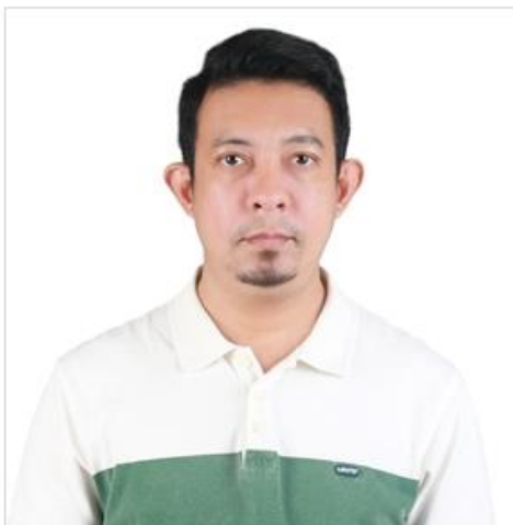
( ตัวอย่างรูปถ่าย )